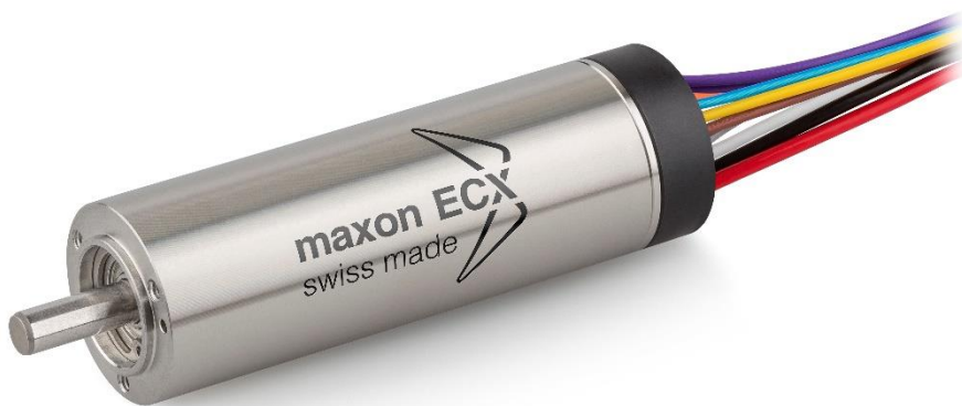
ECX SPEED 19 L: motor DC brushless de alta velocidad.